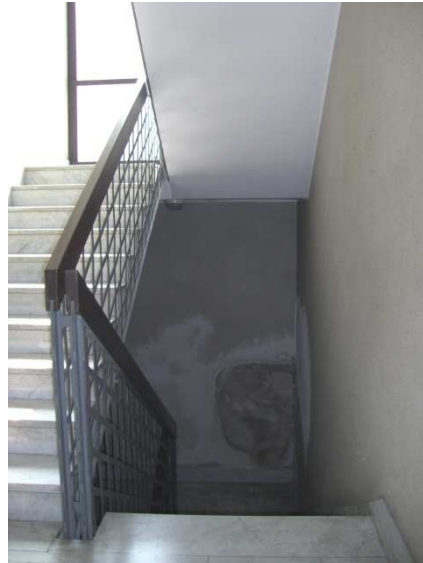
Corridoio d'ingresso alle cantine