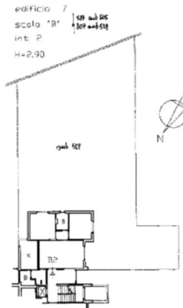
FOTO IDENTIFICATIVE BENE e PLANIMETRIA